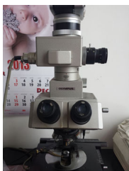
Mikroskop star 40 godina - za "muzejski primerak"